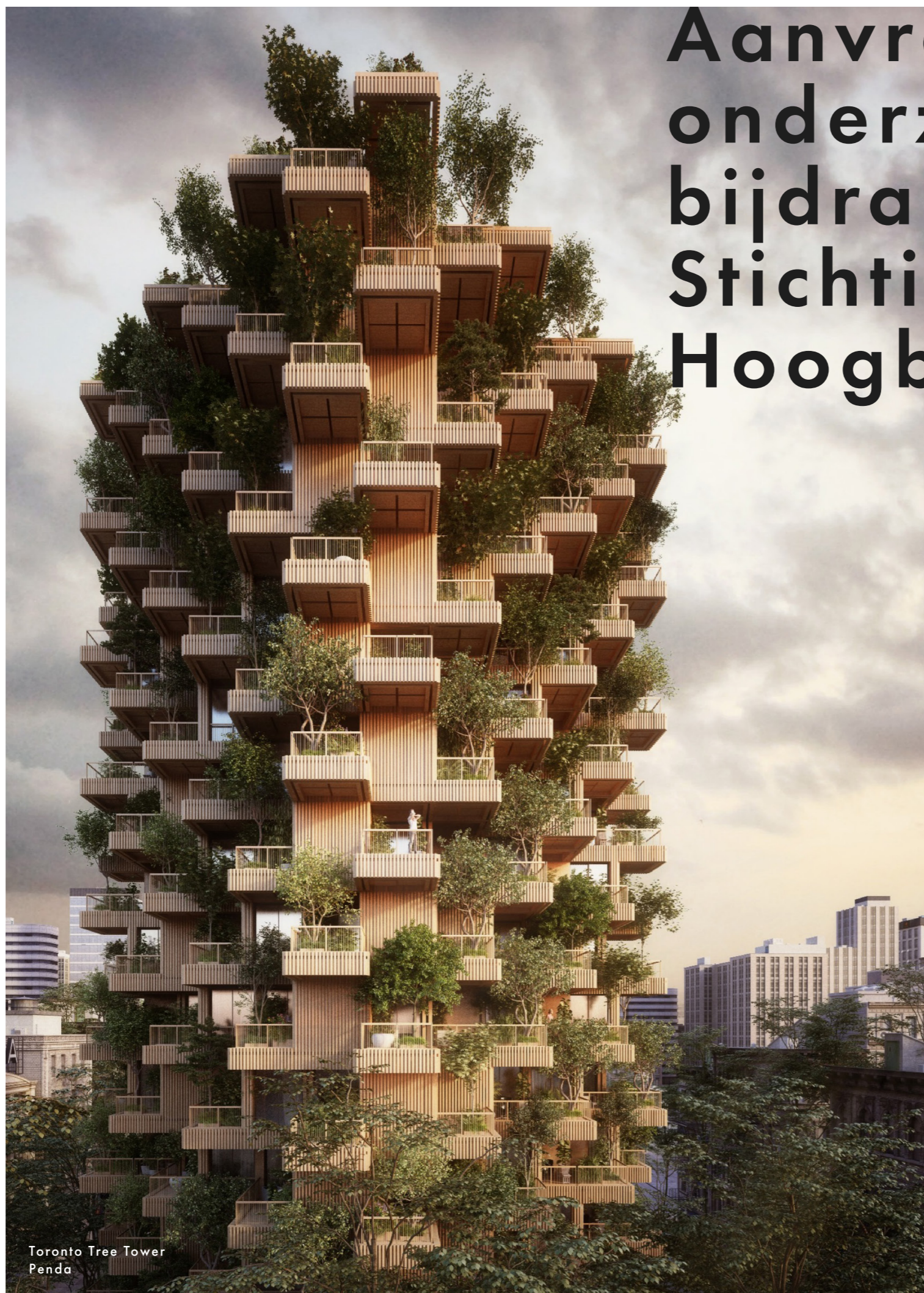
Toronto Tree Tower Penda